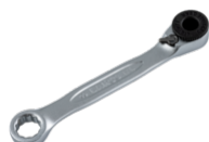
1/4" Clés mixtes à cliquet pour embouts de tournevis 90 mm 6950CBR