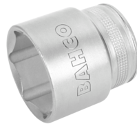
Douille à carré conducteur 1/2" avec profil hexagonal de 23 mm et finition hautement polie 7800SM-23