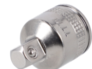
Carré conducteur 3/8" vers adaptateur/réducteur 1/4" 7771