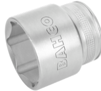
Douille à carré conducteur 1/2" avec profil hexagonal de 8 mm et finition hautement polie 7800SM-8