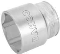
Douille à carré conducteur 1/2" avec profil hexagonal de 13 mm et finition hautement polie 7800SM-13