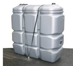
KIT DE SANGLAGE POUR FIXATION CUVE AU SOL