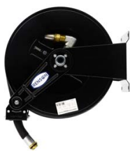
ENROULEUR ACIER POUR GASOIL EQUIPE FLEXIBLE 8M EN 1"